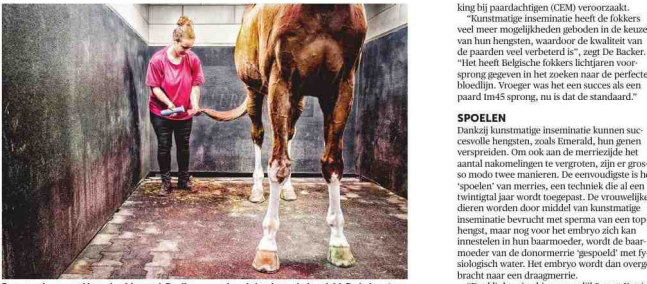
En superieur zaad is veel geld waard. De dieren worden als koningen behandeld. De balen zijn in hun voederbak kunnen uit de champagnestreek, het zachte hooi uit Duitland.

MICHEL VANDENBOESCH DIERENRECHTENORGANISATIE GAIA