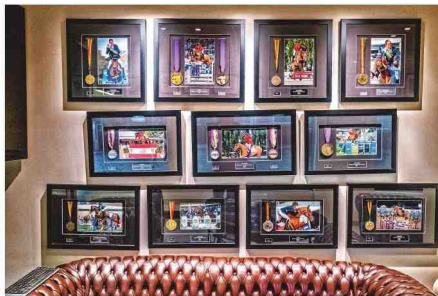
Aan de muur bij paardenhandelaar Axel Verlooy hangen de tekens van de overwinningen die zijn paarden behalen.